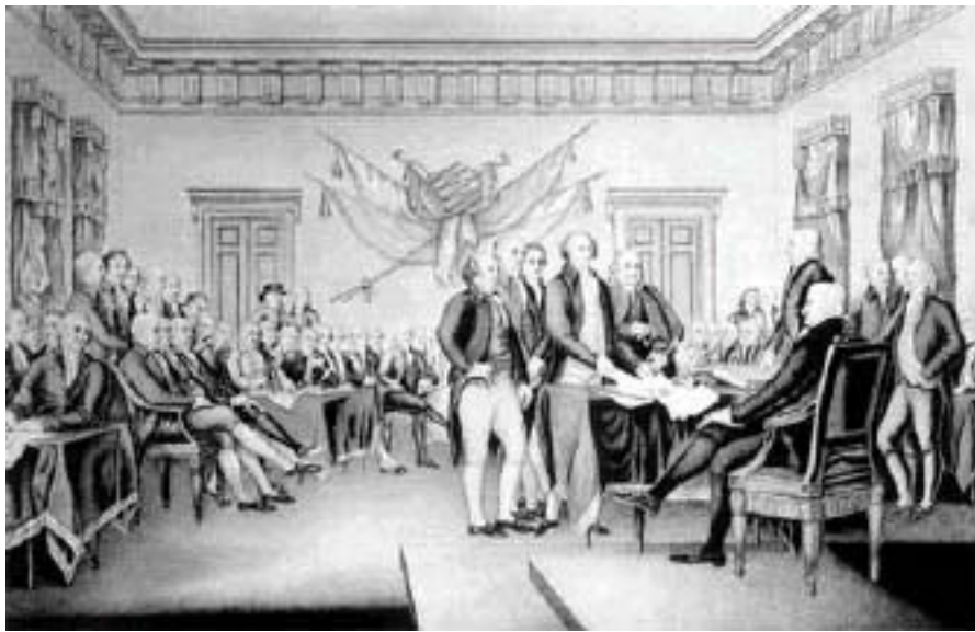
United States Capitol, Washington DC, United States

This painting by John Trumbull, entitled Declaration of Independence (1817), commemorates the signers of the Declaration of Independence, showing them convening in what is today known as Independence Hall. It portrays the committee that drafted the document--John Adams (standing left center), Roger Sherman, Thomas Jefferson (presenting the document), and Benjamin Franklin--standing before John Hancock, President of the Continental Congress, to present the document. The painting also depicts 42 of the 56 signers and five other patriots. The painting currently hangs in the Rotunda of the U. S. Capitol Building. It is based on a smaller depiction of the same scene, held at Yale University. The painting can also be found on the back of the U. S. $2 bill.